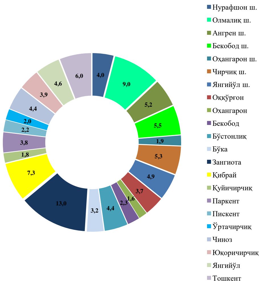
Ҳудудларнинг жами чакана товар айланмасидаги улуши (%да)

Чакана савдо товар айланмаси (умумовқатланиш фаолиятини қўшган ҳолда) аҳоли жон бошига нисбатан ҳисоблаганда 104,2% ни ташкил қилди ва 2953,6 минг сўмни ташкил этди (2018 йил январь-июнь ойларида 2462,3 минг сўмни ташкил этган).